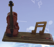
▲音符提琴名片座 定價/$380 約寬14CM*高12CM*深4.5CM