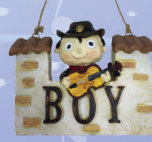
▲小提琴男孩掛牌(附吊繩) 定價/$380 約高9.5CM*寬13CM*深3.5CM