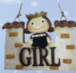
▲鋼琴女孩掛牌(附吊繩) 定價/$380 約高9.9CM*寬12.7CM*深3.7CM