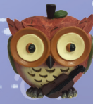
▲貓頭鷹存錢筒(蘋果小提琴) 定價/$800 約高15.4CM*寬15.3CM*深10.6CM

住址：台中市西區五權一街27號 電話：04-2378-2366 傳真：04-2378-0398 各類樂器買賣·日本進口中古鋼琴·各大品牌大小提琴·進口手工長笛·管弦樂器